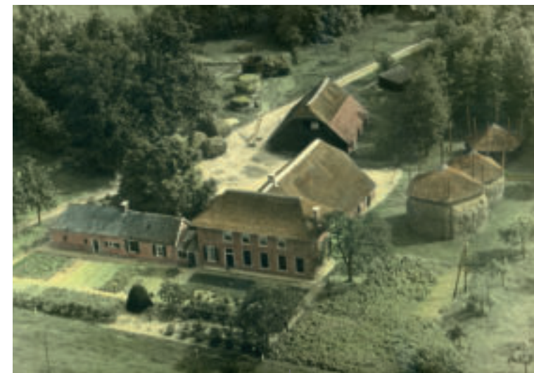
Groot Havikhorst (± 1930-1940)

Dit klompenpad is tot stand gekomen onder coördinatie van Stichting Landschapsbeheer Gelderland in samenwerking met diverse particuliere eigenaren, vele vrijwilligers, de gemeente Barneveld en andere partijen uit de streek. Klompenpaden zijn cultuurhistorische wandelroutes die particuliere terreinen, zoals landgoederen en boerenland, toegankelijk maken voor de wandelaar. Ze gaan zoveel mogelijk over historisch tracé en onverharde paden. Rust, kleinschaligheid en de combinatie van cultuur en natuur bepalen de sfeer en vertellen bewoners en wandelaars over de geschiedenis van hun omgeving. Ook het landschap heeft voordeel van de ontwikkeling van Klompenpaden: vaak worden landschapselementen hersteld en aangelegd. Door aan te sluiten bij lokale initiatieven als landwinkels, horeca en kamperen bij de boer wordt de economie van de streek versterkt.