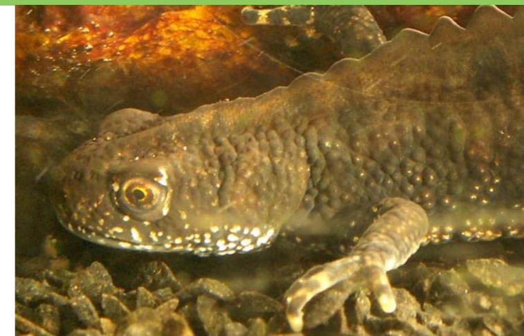
Kamsalamande ♂ ± 1 jaar

Deze fruittuin is ontstaan als landbouw- en zorgproject. Behalve heerlijk fruit levert het ook werkplekken op. Zomers kunt u hier op sommige dagen zelf uw fruit plukken en lekkere jam of sapjes kopen.