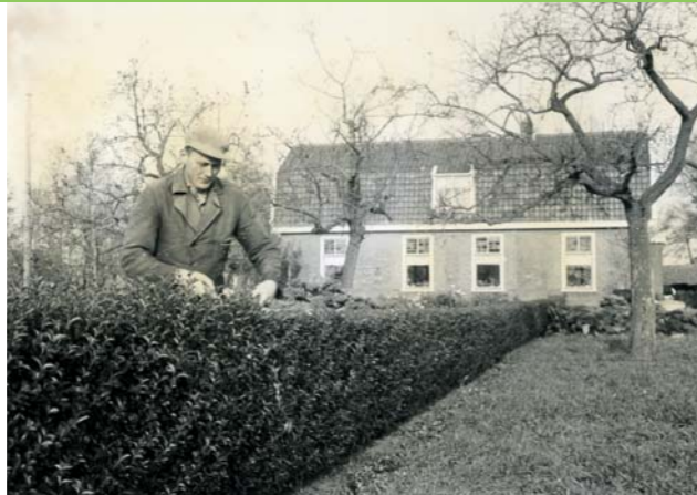
De Wilhelminahoeve ± 50 jaar geleden

Dit klinkt niet alsof u op het juiste pad zit! Waar de naam van deze weg vandaan komt is niet eenduidig te achterhalen. Er wordt geopperd dat er vroeger langs deze weg een boerderij of een herberg