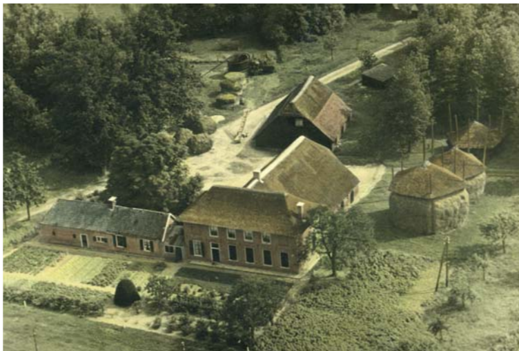
Groot Havikhorst (± 1930-1940)

Op de Schoonderbeekweg loopt het pad een stukje samen met het Snorrenhoefpad, u kunt hier dus ook overstappen.