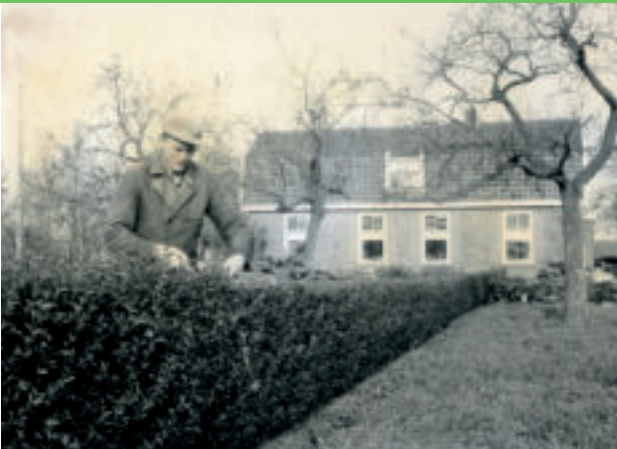
De Wilhelminahoeve ± 50 jaar geleden

Tijdens oogstwerkzaamheden kan het (uiterst zelden) voorkomen dat het pad om veiligheidsredenen even wordt afgesloten (wordt met bord gemeld bij ingang pad). U kunt dan via de Postweg en Helweg uw route vervolgen (zie kaart).