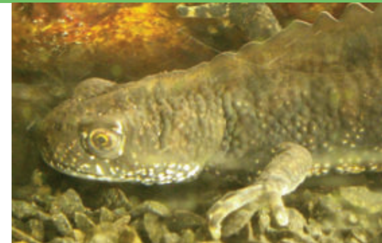
Kamsalamander ♂ ± 1 jaar

Deze fruittuin is ontstaan als landbouw- en zorgproject. Behalve heerlijk fruit levert het ook werkplekken op. Zomers kunt u hier op sommige dagen zelf uw fruit plukken en lekkere jam of sapjes kopen.