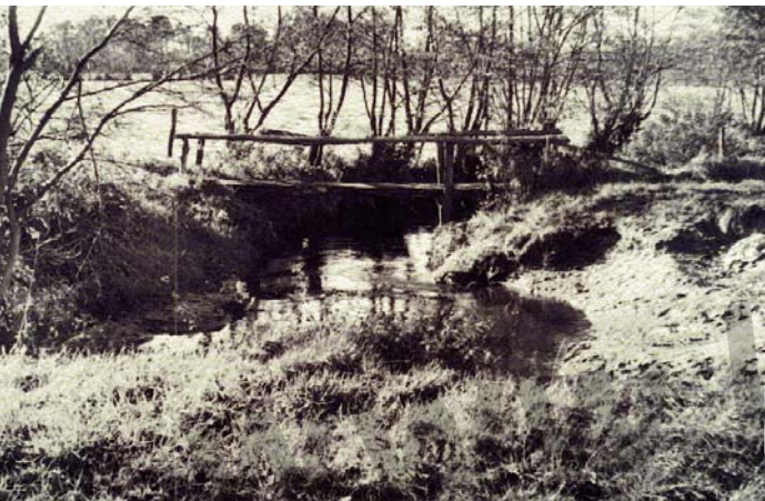
Modderbeek rond 1960, toen nog meanderend

In het bos dicht bij boerderij Duurkoop vindt u langs het wandelpad rabatten. Rabatten werden gemaakt door het graven van greppels, waarbij de vrijkomende grond telkens op de eraanst gelegen strook grond werd gedeponerd. Vervolgens konden de bomen op de verhoogde grond, de rabat, geplant worden. Zo werden percelen die te nat waren toch nog nuttig gebruikt voor de teelt van hakhout. Hakhout was vroeger van levensbelang. Het werd voor allerlei doeleinden gebruikt. Bijvoorbeeld voor het zetten van heiningen, om landhekken van te maken en natuurlijk om te stoken. Omdat hout zoveel waarde had, werden de bomen op de grond van de boerderij apart verkocht. Het hout was niet alleen voor de eigenaren lucratief, het gaf ook veel werkgelegenheid. Zo waren