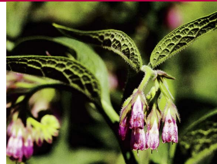
Smearwortel, vaak langs wegbermen en slootkanten te vinden