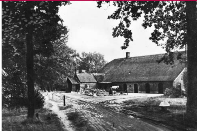
Hoeve Groot Zandbrink en onverharde Postweg, rond 1950

Vanuit het bos loopt u recht op de Modderbeek af. Beken vormen een kenmerkend onderdeel van het landschap rond Achterveld. De Modderbeek stroomt vanuit Barneveld en gaat richting Stoutenburg. In de negentiende eeuw klaagden boeren uit de buurt dat deze beek in de herfst en de winter buiten haar oevers trad. Om de waterafvoer ten behoeve van de landbouw te verbeteren is de Modderbeek toen tweemaal gekanaliseerd. Waterschap Vallei en Eem heeft de huidige watergang en de schouwpaden in eigendom. Het schouwpad is door het waterschap opengesteld voor wandelaars en staat in het voorjaar vol fluitenkruid.