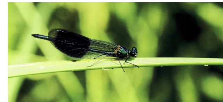
Weidebeekjuffer, liefhebber van stromend water