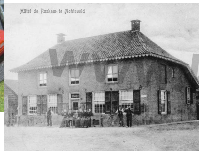
Hotel de Roskam, begin vorige eeuw

Startpunt → Café-restaurant de Roskam, Hessenweg 212, Achterveld Openbaar vervoer → Buslijn 79 (uit Amersfoort of Barneveld), halte bij de kerk